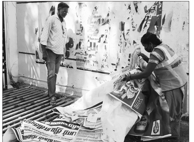
சேப்பாக்கத்தில் சுவரில் ஒட்டப்பட்ட அரசியல் கட்சியின் சுவரொட்டிகளை மாநகராட்சி ஊழியர்கள் அகற்றினர்.