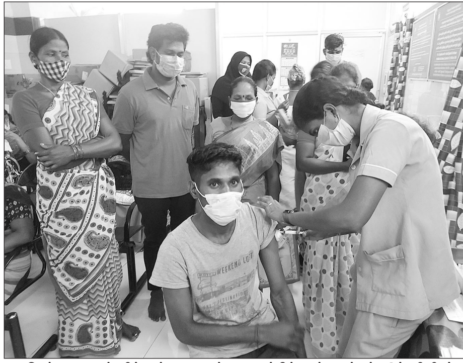
சென்னை எழும்பூரில் உள்ள நலவாழ்வு மையத்தில் நடந்த பூஸ்டர் தடுப்பூசி சிறப்பு முகாமில் தடுப்பூசி போட்டுக் கொண்டவர்கள்.

இவ்வாறு அவர் கூறியுள்ளார். களில் ஒட்டப்பட்டு இருந்த சுவரொட்டிகளை ஊழியர்கள் கிழித்து அப்புறப்படுத்தினார்கள். தலைவர்களின் சிலைகள் இதேபோன்று தலைவர் களின் சிலைகளை மூடி வைக்கும் பணிகளும் நடைபெற்று வருகிறது. சாலை ஓரங்களில் அரசியல் கட்சி தலைவர்களின் சிலைகளை சர்க்கு மூட்ட அல்லது தனியால் மூடி வைக்கும் பணியிலும் அரசு ஊழியர்கள் ஈடுபட்டு இருக்கிறார்கள்.